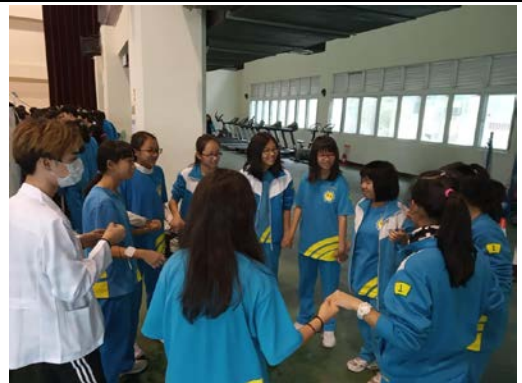
拍照日期：107年12月12日 照片說明：電刺激治療體驗