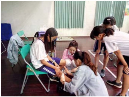
拍照日期：107年5月20日 照片說明：苗栗高中--醫護站