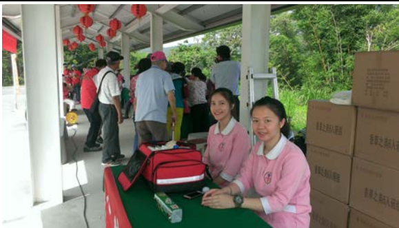
拍照日期：107年5月23日 照片說明：苗栗郵局--醫護站