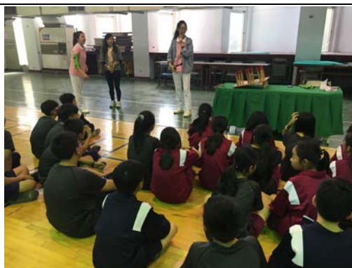
拍照日期：107 年 12 月 4 日 照片說明：老人體驗