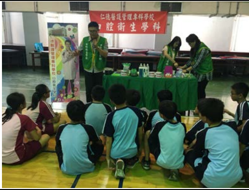
拍照日期：107年12月4日 照片說明：牙齒刷刷樂