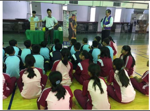
拍照日期：107年12月4日 照片說明：安全疊疊樂