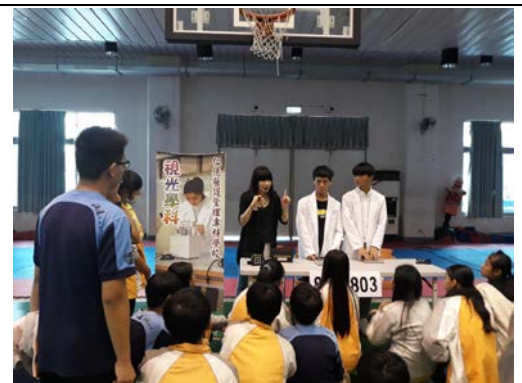
拍照日期：107年12月19日 照片說明：看不見/看得見