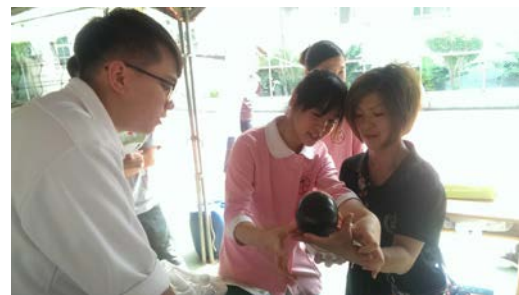
拍照日期：107年5月25日 照片說明：培英國中--新生兒沐浴體驗