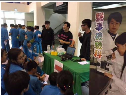
拍照日期：107年12月12日 照片說明：腦波檢測應用