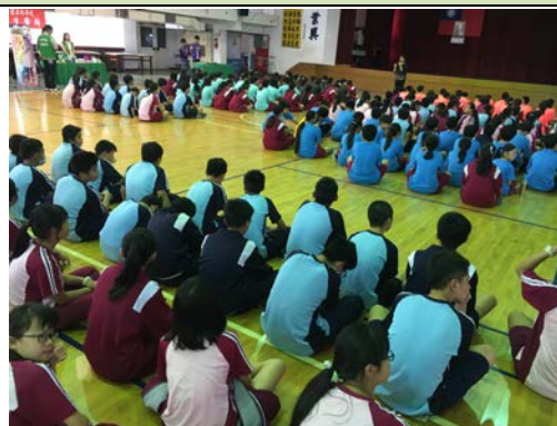
拍照日期：107 年 12 月 4 日 照片說明：課程解說