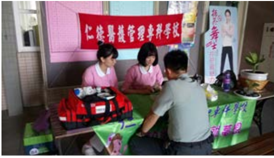
拍照日期：107年5月19日 照片說明：苑裡高中--醫護站