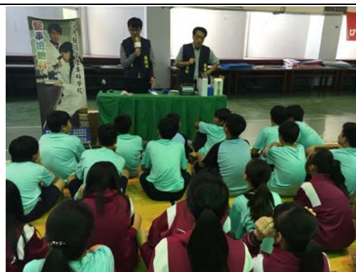
拍照日期：107 年 12 月 4 日 照片說明：腦波檢測應用