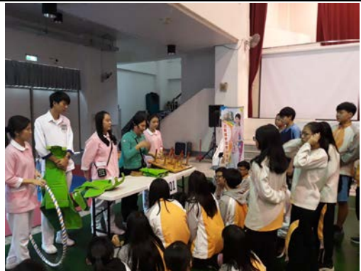
拍照日期：107年12月19日 照片說明：老人體驗