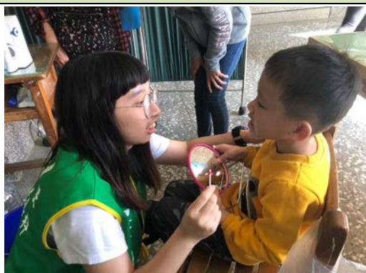
拍照日期：107 年 12 月 1 日 照片說明：牙菌斑無所遁形