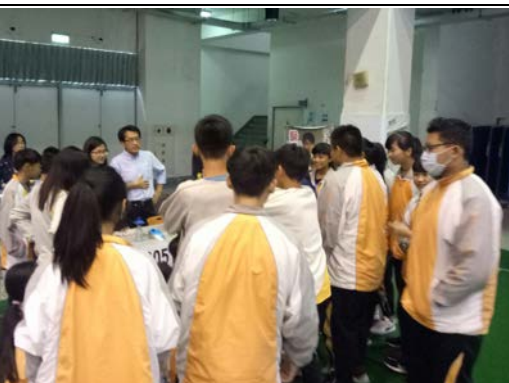
拍照日期：107年12月19日 照片說明：腦波檢測應用