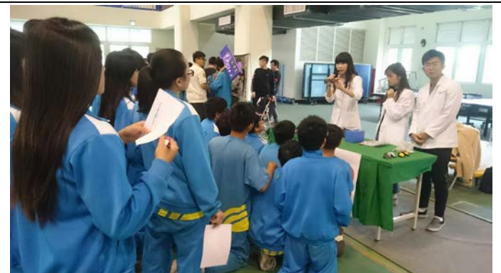
拍照日期：107年12月12日 照片說明：看不見/看得見