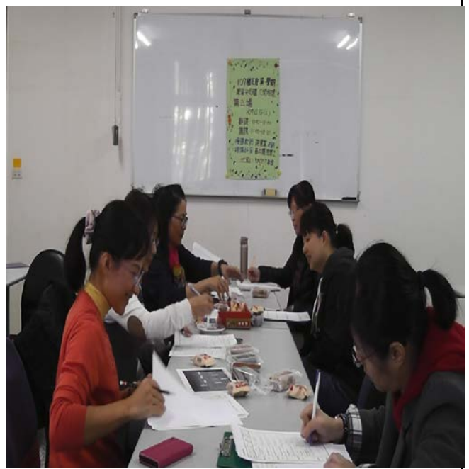
拍照日期：107年12月19日 照片說明：教師社群議課中