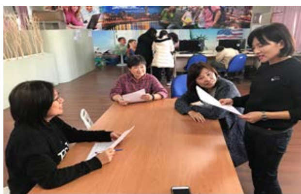
拍照日期：107 年 12 月 17 日 照片說明：英文組社群教師議課中