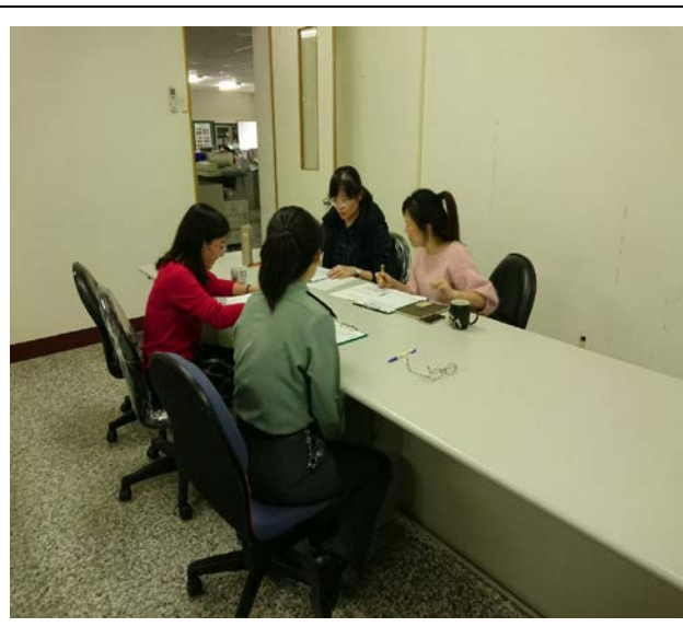
拍照日期：107年12月21日 照片說明：教師社群議課中