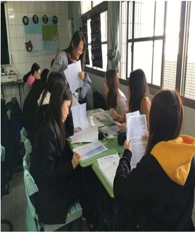
拍照日期：107年12月14日 照片說明：學習的風景-師生互動。