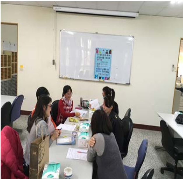
拍照日期：107年12月14日 照片說明：教師社群議課中。