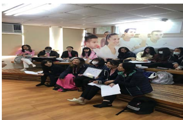
拍照日期：107 年 12 月 17 日 照片說明：參與課程同學專注聽老師說明