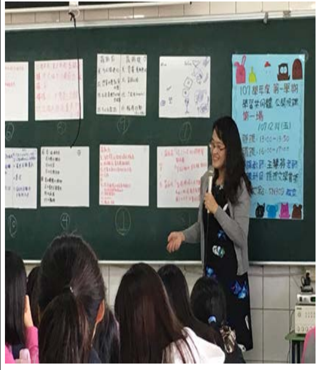
拍照日期：107年12月14日 照片說明：學生分組白磁貼展示分享。