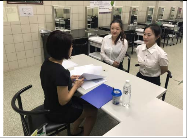
拍照日期：2019年10月8日 照片說明：佐登妮絲國際股份有限公司涂副理與學生對談