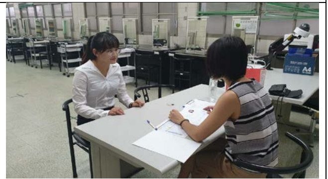
拍照日期：2019年10月9日 照片說明：星醫美學股份有限公司邱專員與學生對談