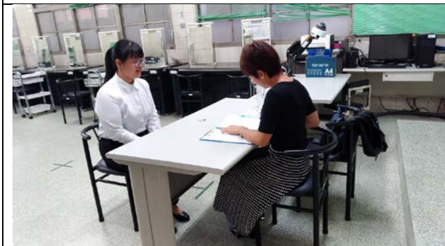
拍照日期：2018年10月15日 照片說明：唯逗國際有限公司簡經理與學生對談