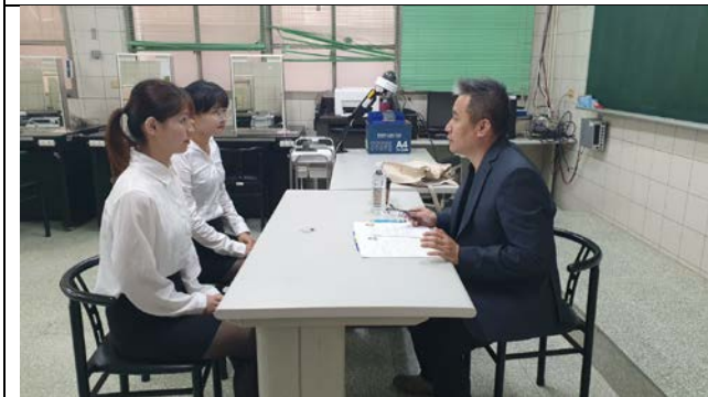
拍照日期：2019年10月9日 照片說明：泰安觀止溫泉股份有限公司李主任與學生對談