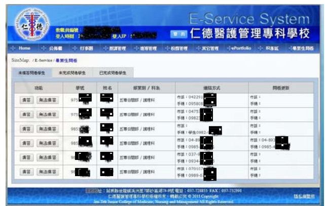
照片說明：老師電訪學生問卷調查(Web)