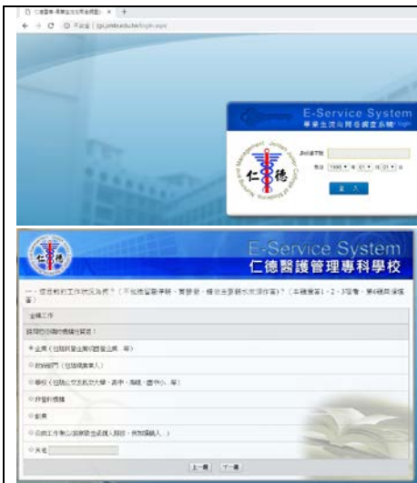
照片說明：學生問卷調查(Web)