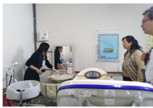
照片說明：高齡觀科參觀教學場地