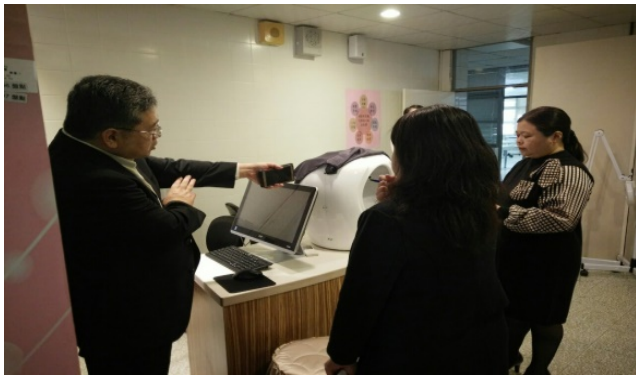
照片說明：健美觀科參觀教學場地