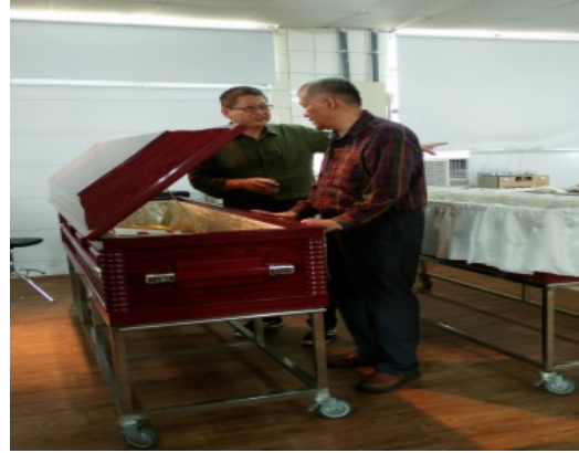
照片說明：生關觀科參觀教學場地