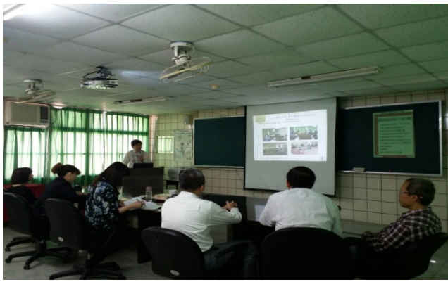
照片說明：調保科品保簡報會議